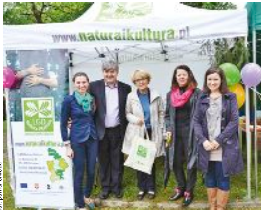
for. powiat otwocki

Piknik zgromadził liczne grono zarówno mieszkańców obszaru, jak i turystów. LGD Natura i Kultura, jako jeden ze sponsorów wydarzenia pojawiło się na pikniku wraz ze swym stoiskiem promocyjnym. Oprócz własnych publikacji informujących o dotychczasowych osiągnięciach grupy i możliwościach wsparcia ciekawych projektów w ramach Osi IV PROW 2007-2013, oferowaliśmy także dobrą zabawę w postaci bezpłatnej loterii fantowej, której przedmiotem były ciekawe gadzety. Nasz namiot wystawienniczy odwiedziło wielu dorosłych i dzieci. Mieli oni okazję spróbować soku jabłkowego, którego produkcja jest przedmiotem projektu realizowanego przez naszego beneficjenta w ramach działania Różnicowanie w kierunku działalności nierolniczej. W naszym namiocie mieli-