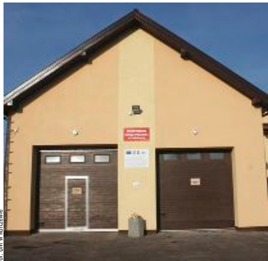
for. UM w Karczewie

Opis operacji: W ramach projektu wykonano prace remontowe polegające na rozbiórce pokrycia dachowego i utylizacji płyt azbestowo-cementowych, wykonaniu nowego pokrycia dachowego, przemurowaniu